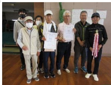
活躍された3区の皆さん